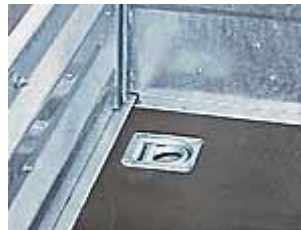
Détail : anneau se sanglage