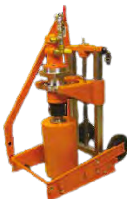
Moteur pneumatique LZL15