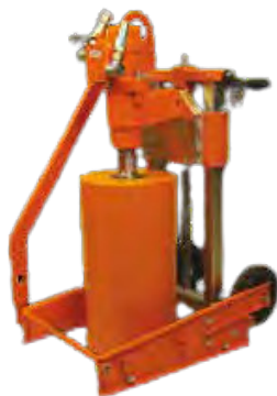
Moteur hydraulique HBM100