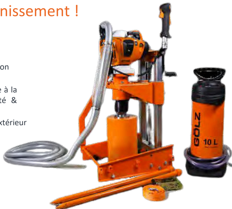
Moteur thermique STIHL FS560

Équipement standard pour utilisation dans l'assainissement :